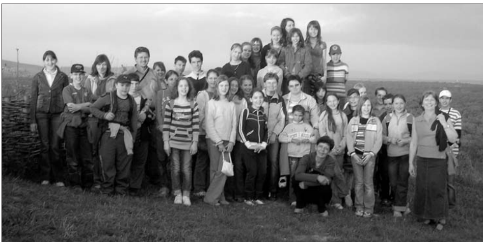
JUTALOMÚT – 2008. április 26. – Szatmári körút

Hazánkban első alkalommal rendeztek focitornát 60 éven felüliek számára Újfehértón április 6-án. Az ötlet a népszerű sportembertől, Csukrán Mihálytól származik, s az ő Honvéd utcai sportpályáján rendezték meg a „nagyapák“ tornáját. A focitornát az MLSZ is bevette a 2008-as versenynaptárába. Újfehértó után a kupasorozat részeként Balkányban 2008. május 24-én 14:30 kezdettel volt az összecsapás, majd Nyíradonyban, Balatonfűzfőn, Nagykállóban, Győrben, Pápán és Budapesten folytatódik a játék. KÉP>>>