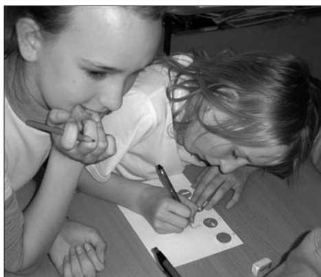
KÖZLEKEDÉSI VERSENY 2008. ápr. 29. 3–4. évfolyam