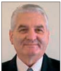
Oláh János alpolgármester