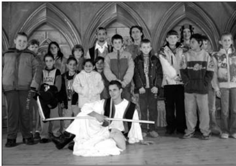
SZÍNHÁZI ELŐADÁS balkányban – alsó tagozat