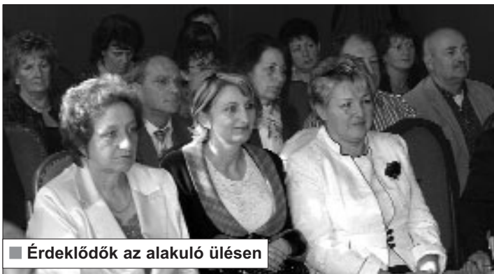
■ Érdeklődők az alakuló ülésen