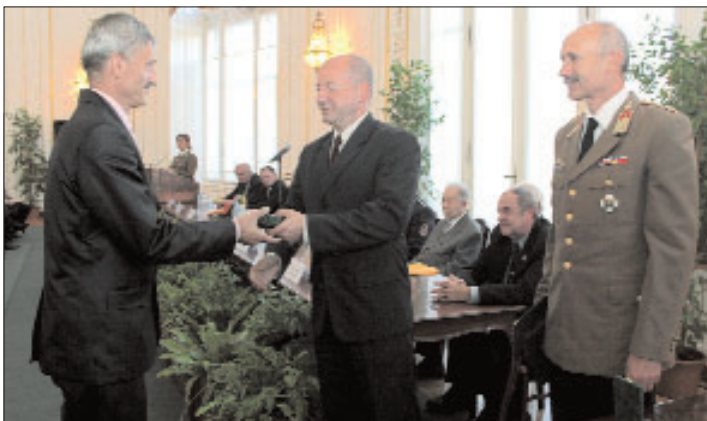
Pálosi László polgármester október 23-án alkalmából „Honvédelemért“ emlékérmét vett át a Honvédelmi Minisztériumban.

Végeredmény: magasba emelt csöppnyi kezek, így jelképezve, hogy a Kézmosás Világnapján Ők tanultak valamit a higiénia jelentőségéről. Reméljük, a hagyomány tovább folytatódik, és jövőre több osztály kapcsolódik a Világnapi Programsorozathoz.