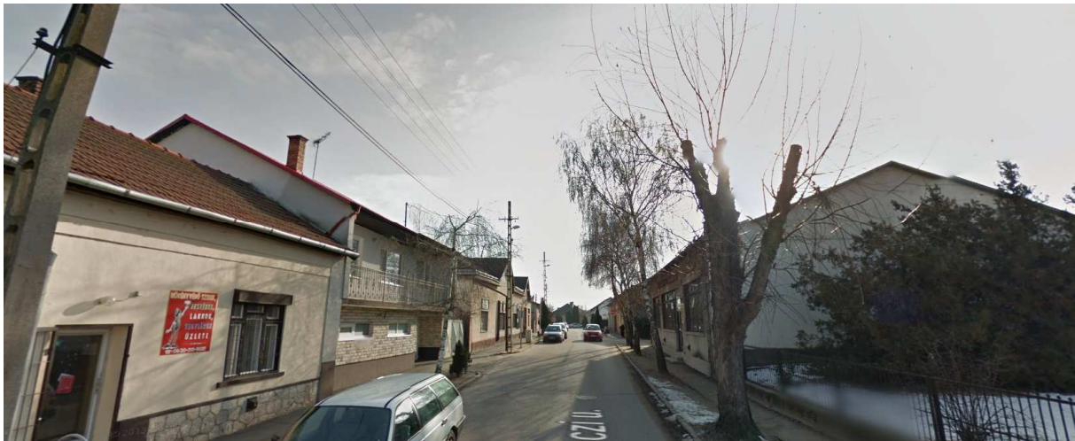
Rákóczi u. a Kossuth L. u. felől

A telkek változatos képet mutatnak, viszont a 600-3000 m 2 -es térmértékig terjednek, de a Rákóczi u. felől alakultak ki a nagyobb telekméretűk, melyek a legnagyobb értékhez közelítenek. Ehhez mérten a beépítési % értéke is magas a kis térmértékű telkek esetében. A tömb középső részén, a Váci M. u. környékén álló teleksor a korábbi észak-déli irányú keskeny telektestek felosztásával keletkeztek.