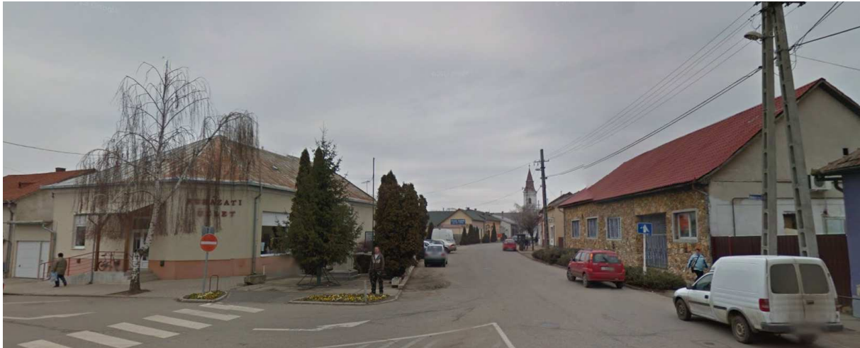
Rákóczi u. – Fő u. kereszteződés

A tervezett módosítás esetében a vizsgálat alá vonható terület a Rákóczi u. – Kossuth u. – Iskola u. – Fő utca által határolt tömb, mely a 4102 - Nyírtura-Nyíradony összekötő út, szelvényszám: 31 km 1200 m-nél közelíthető meg. A tömb a Város központi részét képez, közintézmények sora áll a tömbben, illetve annak közvetlen környezetében. Ennek megfelelően a terület-felhasználás településközpont vegyes terület. Az érintett Rákóczi u. beépítése előkert nélküli elsősorban. A hatályos TRT. szerinti építménymagasságokkal az utca téraránya 1:2(3) érték körül alakul, mely a városiasabb környezetben kedvezőtlen érzetet kelt.