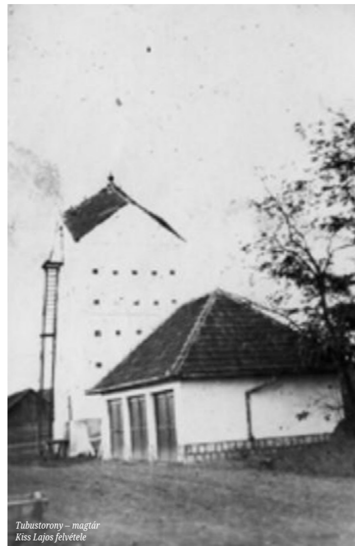
Tubustorony – magtár

vére nem is, de kastélyára emlékeznek. Ám ez a Gencsy-kastély nem az a Gencsy-kastély, ami városunk központjában található. Ez bizony egy másik gyönyörű