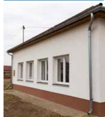
A múlt ősszel felújított közösségi ház Tormáspusztán