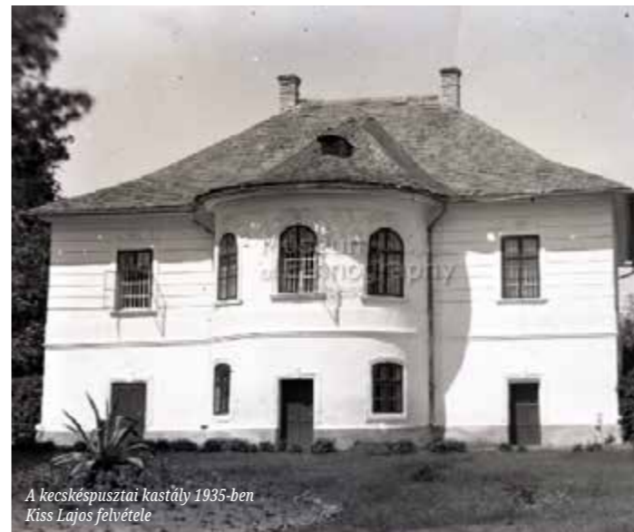
A kecskéspusztai kastély 1935-ben