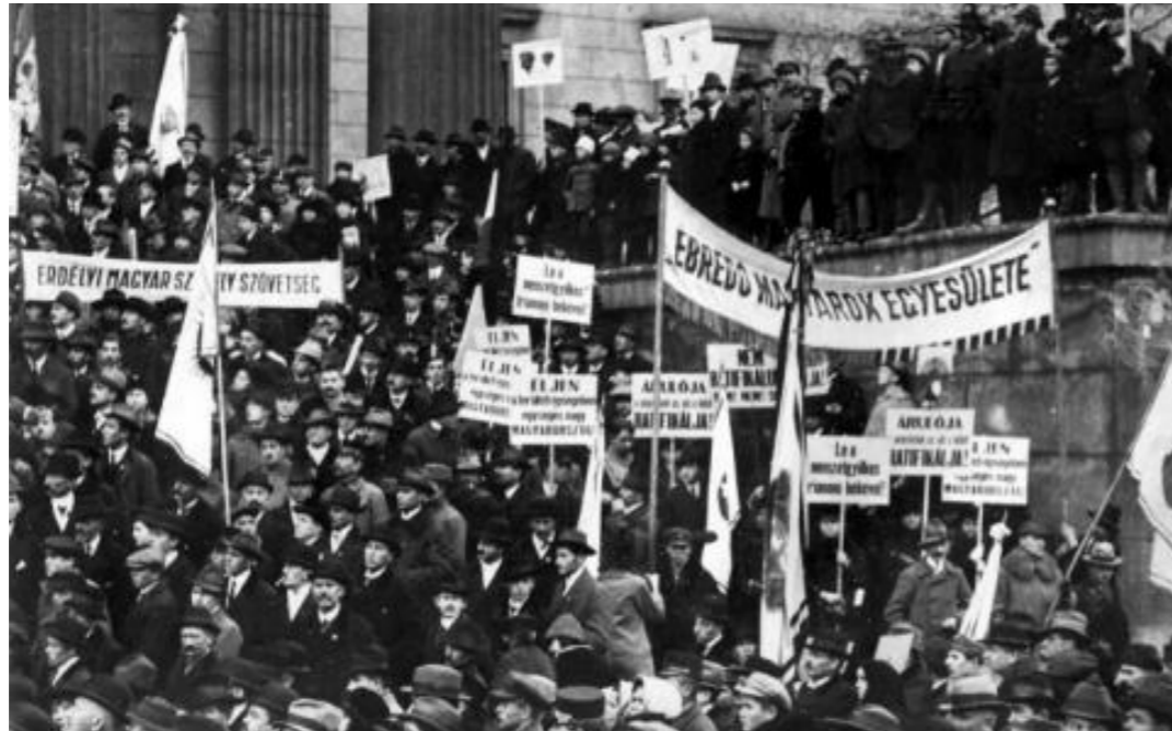
A trianoni szerződés ratifikálása alkalmából rendezett tüntetés a Magyar Nemzeti Múzeum előtt

Már 1916. október elején, a románok erdélyi bevonulása után, 187 erdélyi menekült érkezett Balkányba, Ilyésmező, Szováta, Székelyszentiván, Geges, Korond, Parajd, Erdőszentgyörgy, Kibéd, Sóvárád településekről. A menekültek lakosainknál voltak elszállásolva. Élelmet, szállást biztosítottunk számukra. 1916. novemberben-decemberében hagyták el településünket. Névsorukat, iskolába járó gyerekeik adatait nagyrészt ismerjük. A később kijelölt új határvonal Nyírábránynál, Balkánytól mindössze 25-30 km-re húzódott és húzódik ma is. Csak a szerencsénken és némi külső hatás gyakorlásán múlott, hogy a Tiszáig, később Budapestig előrenyomuló román hadseregnek nem az akkori tartózkodási helyét tekintették az új határnak. Egyes román csapatok még Győrbe is bevonultak. Ezt laikusként értelmezhetnénk úgy is, hogy ez a román hadsereg és a többi hazánkba bevonuló ellenséges had vitézségének köszönhető. De ez nem így van. Károlyi hatalomra jutása után elrendelte a magyar haderők teljes leszerelését, és nem akadályozta meg az ellenséges csapatok bevonulását. Az ellenséges hadsereg nem rendfenntartási céllal, hanem mint megszálló érkezett. A Károlyi-kormány bukása után hatalomra kerülő Kun Béla vezette kommunistákat, az antant nem tekintette egyenrangú tárgyalófelelnek. Így már a kezdeti tárgyalási alap is rendkívül rosszul alakult.