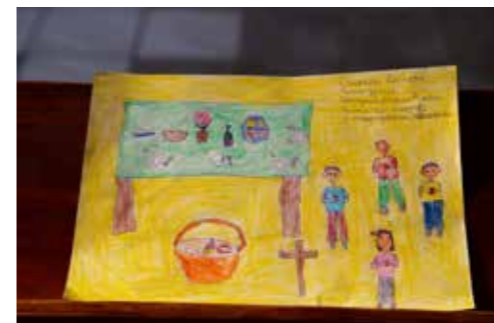
Óvodás korosztály 2. helyezett: Csontos Levente