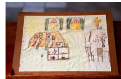
Iskolás korosztály 1. helyezett: Molnár Boglárka