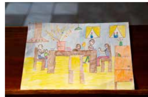
Óvodás korosztály 1. helyezett: Mányák Orsolya