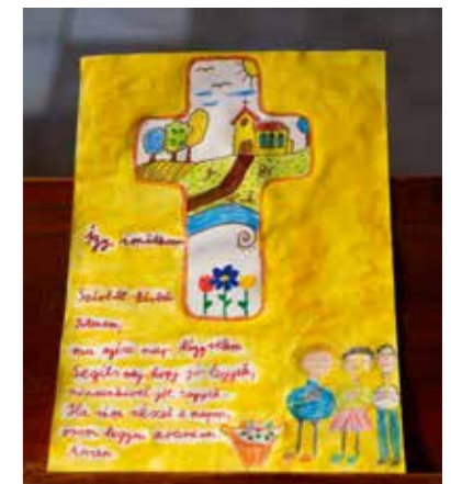
Iskolás korosztály 3. helyezett: Csordás Bálint Benedek