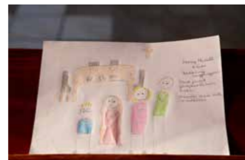
Óvodás korosztály 3. helyezett: Herczeg Marcell