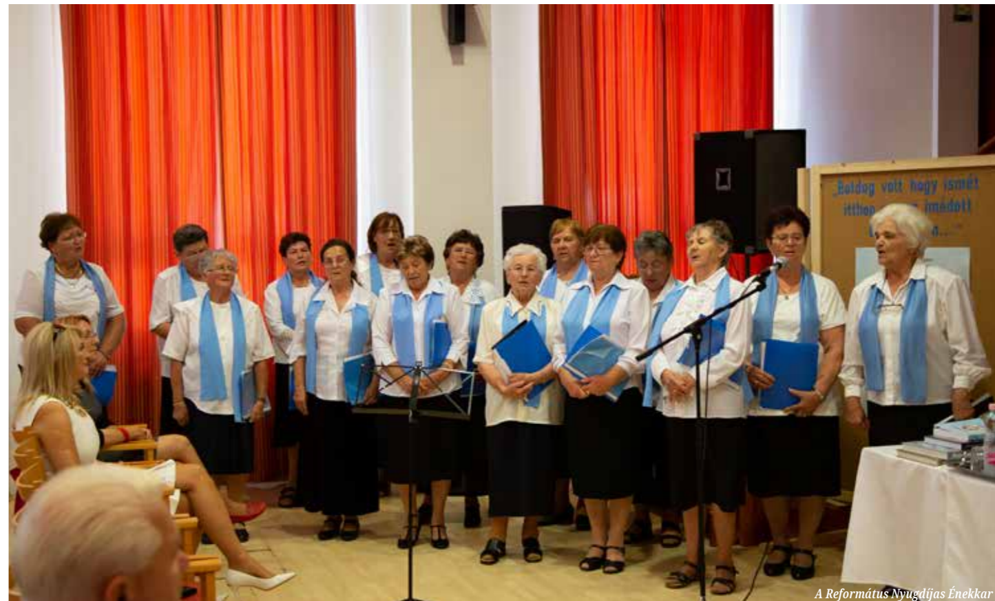
A Református Nyugdíjas Énekkar

valamint a Világklub több megyei képviselőjét. Beszédében kiemelte, balkányiként csodálatos érzés megtapasztalni, hogy a regény közszeretetének köszönhetően országosan milyen sokan érdeklődnek településünk iránt.