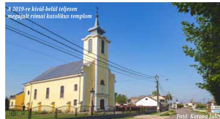
A 2019-re kívül-belül teljesen megújult római katolikus templom

hogyan a Kossuth úti római katolikus templom alapkövét 1937. március 14-én tették le?